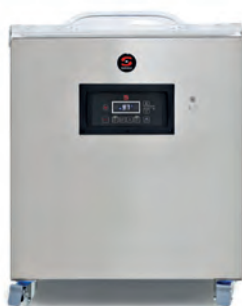
SE SERIA 600