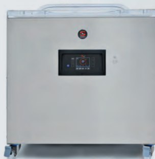
SENSOR ULTRA SERIE 800