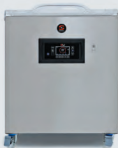
SENSOR ULTRA SERIE 600