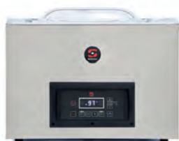
SE SERIE 200, 300, 400 I 500