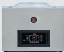
SENSOR ULTRA SERIE 300, 400 I 500