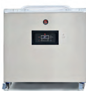
SE SERIA 800