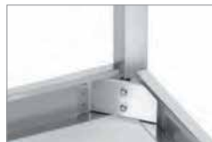
SOLIDNE MOCOWANIE NÓG ZA POMOCĄ DWÓCH ŚRUB