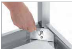
KLUCZ IMBUSOWY DO SZYBKIEGO MONTAŻU