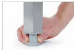
POZIOMOWANIE I REGULACJA WYSOKOŚCI STOŁU